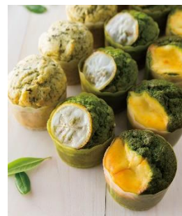
ご当地マフィンイメージ （福岡県産：八女茶使用）