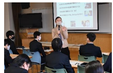
中学校への派遣授業の様子

これらの施策により、変化の激しい時代にも対応できる企業として、引き続き“日本で一番質の高い食 & ホスピタリティ”の提供に努めてまいります。