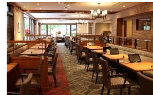
2023年4月開店 直営新店舗 光が丘 IMA 店