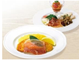
商品イメージ（2023年事例）